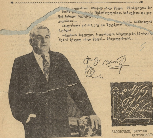
კომპარტიის წევრი, საბჭოთა კავშირის დამსახურებული მუშაკი...