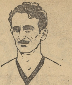
ს. ჯ. ჯ. ჯ. ჯ.