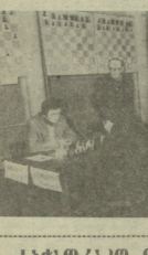
სამხატვრო, 21 თბილისი (გაგლიანი, ადვოკატი ხეცა, კონსტანტინე) მიხედვით...