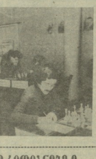
სამხატვრო, 21 თბილისი (გაგლიანი, ადვოკატი ხეცა, კონსტანტინე) მიხედვით...