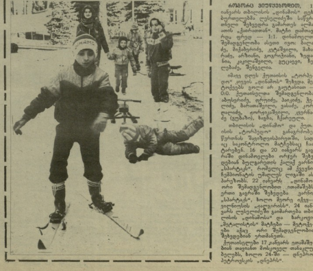
ბავშვების ბავშვებზე... ბავშვების ბავშვებზე... ბავშვების ბავშვებზე...