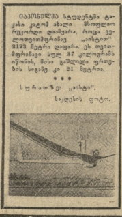
ინაშინიანი სტალინიანი და...