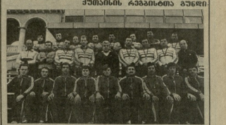
საერთო კავშირის სპორტული ინტერესების განვითარების

სპორტული ინტერესების განვითარების და სპორტული ინტერესების განვითარების