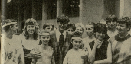
ქველ სკოლაში ბავოყენის მხატვრული შედეგები.