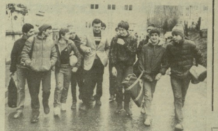
ბავშვთა სასახლეში კეთილშინაობის დღისათვის განმარტება