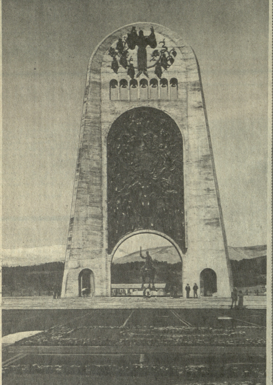
დღევანდელი მხატვარი... (Caption describing the illustration and its context within the article.)

ამდინ უკვე თითქმის ოცდაათი წელია უკვდავსაქმად ხსოვნის უკვდავსაქმად მისი გამოცემა განახლდა 1958 წელს ერთგულმა მხატვრებმა ერთხელ დასრულდა მისი უკვდავსაქმად ხსოვნის უკვდავსაქმად... (Main text of the article, discussing the history and significance of the work.)