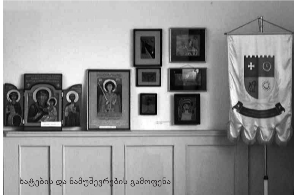
ხატების და ნამუშევრების გამოფენა