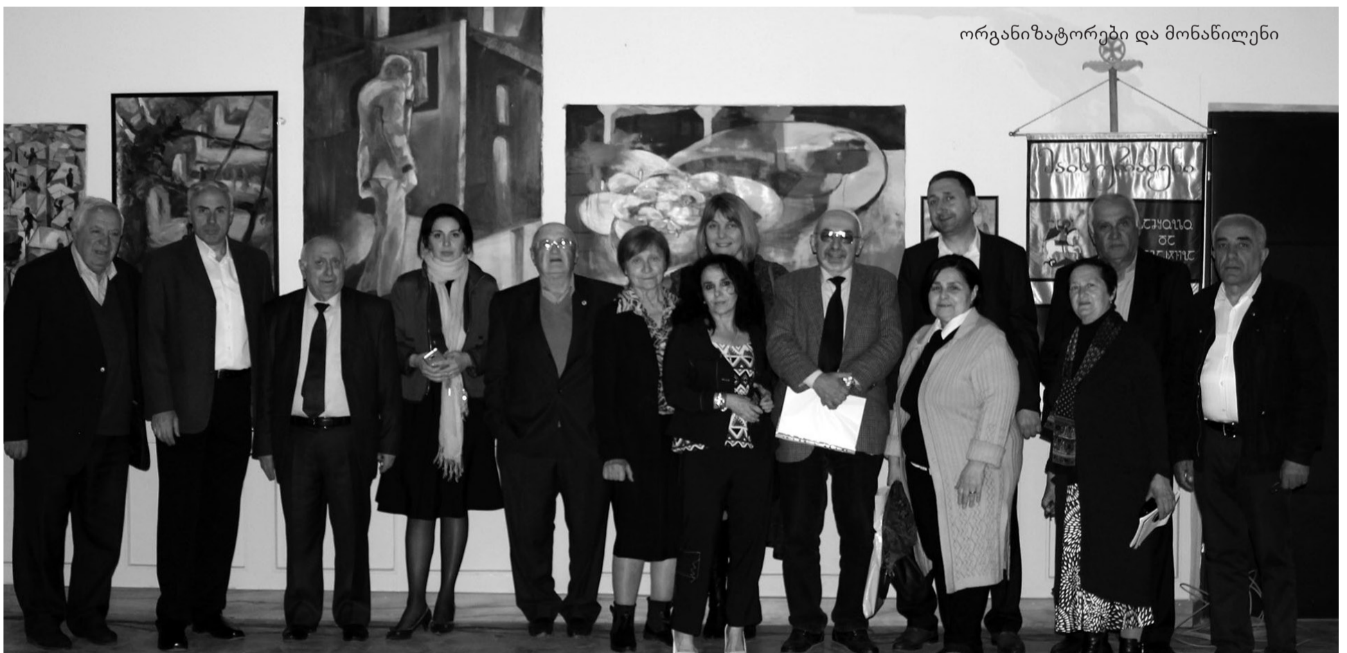
ორგანიზატორები და მონაწილენი

რაშვილმა. მან მადლობა გადაუხადა დამსწრეებს მობრძანებისათვის, მონაწილეებს შესრულებული სიმღერებისათვის ასევე გადაუხადა მადლობა საპატრიარქოს ტელე-