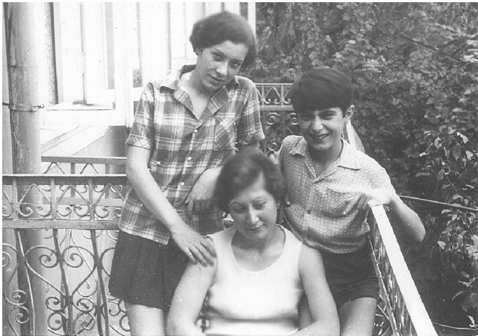
შვილები: ზის ლალი მხატვარი დგანან: მზია და გიორგი მხატვარი