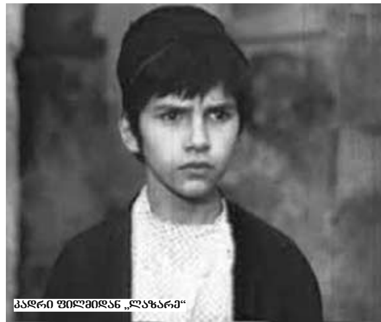
პადრი ფილმიდან „ლაზარე“