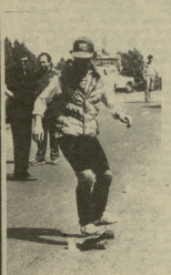
სსრს ობიექტი № 100 (681) 26 მაისი 1984 წ. 3 კვ., 13 საბედროსი

პირველი კომიტეტის და სკოლის შიშის სივრცითი ვიდეო ტიპის ცეცხლი...