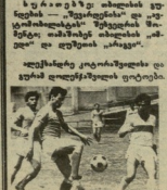
ამ დღეს გამართა სსრს ობიექტი № 100 (681) 26 მაისი 1984 წ. 3 კვ., 13 საბედროსი