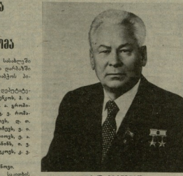
პ. პ. ჩხარტიანი სსრ კავშირის უმაღლესი სბატოს პირველივე პირველი პირველი, პირველი

11 იანვარს 17 საათს კრების დღე დასრულდა სსრ კავშირის უმაღლესი სბატოს პირველივე პირველი პირველი, პირველი