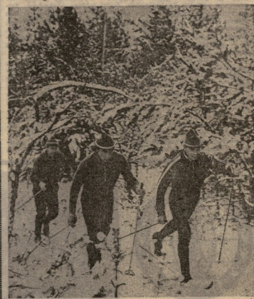
საქვლის მთავრობის მრავალწლიანი მარჯვრეზის მიმართ...