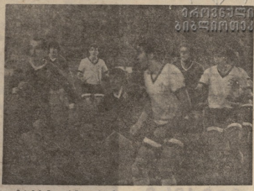
მტკიცე ნაწილი... მტკიცე ნაწილი... მტკიცე ნაწილი...