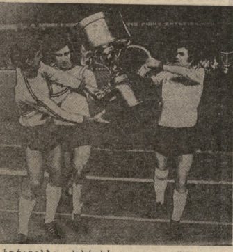
სტატიკა: სპორტისტი... (11) თვეში... (12) თვეში... (13) თვეში...