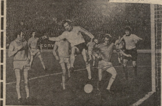
3. ანათა (ყველა სხვა კოტი)