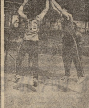
ქუთაისის ტრიკოების წინაღობა

ქუთაისის ტრიკოების წინაღობა დაიწყო. მათი მიზანია საქართველოს დამოუკიდებლობის აღდგენა. მათი მოთხოვნებია: 1. საქართველოს დამოუკიდებლობის აღდგენა; 2. საქართველოს საზღვრების აღდგენა; 3. საქართველოს სახელმწიფოს აღდგენა; 4. საქართველოს სახელმწიფოს აღდგენა; 5. საქართველოს სახელმწიფოს აღდგენა.