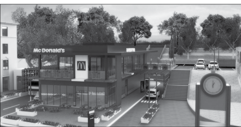
„მაკდონალდსის“ პროექტის ესკიზი

ქუთაისის საზოგადოებას ახალი პროექტი წარუდგინეს, თუმცა, პროექტში, ფაქტობრივად ბევრი არაფერი შეცვლილა, შენობა უბრალოდ, უფრო მწვანე ფერშია გადაწყვეტილი. პრეზენტაცია საკმაოდ რთულ და დაძაბულ სიტუაციაში წარიმართა, ფაქტობრივად ძალიან ემოციურ დაპირისპირებაშიც კი გადაიზარდა: „ჩემი 3500 წლის ქალაქის ისტორია არ იწყება მაკდონალდსის ჯიხურით თუ პავილიონით!“ , „ესაა კანალიზაციის ტრუბა ქუთაისში... ამის აშენებას კიდევ ის სჯობს, ტუალეტები მაინც აუშენეთ ტურისტებს“, „რომელი ტურისტი ჩამოდის ქუთაისში ჰამბურგერის საჭმელად?“, „ეს ყველაფერი იმის ბრალია, რომ არ არსებობს ქუთაისის განვითარების გეგმა და ვისაც სად და რა მოეხსიათება, იქ ჩაღვამს რასაც უნდა!“ - ესაა იმ ფრაზების ნაწილი, რაც ქალაქის მოსალოდნელი დამახინჯების მოწინააღმდეგე ქუთაისელებმა