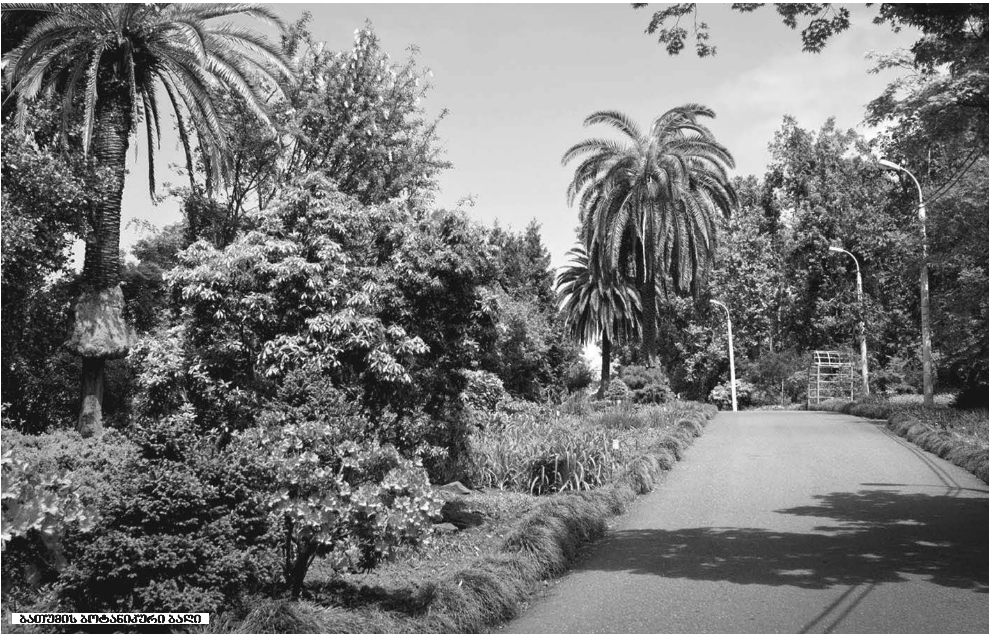
გათუების პოტანოპური ბაღი