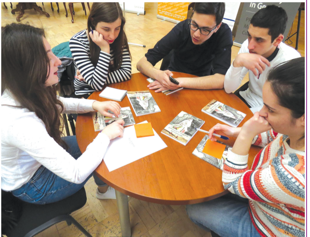
ორგანიზატორების თქმით, აღნიშნული კამპანია სამომავლოდაც გაგრძელდება და უფრო ფართო მასშტაბს მიიღებს.

აღსანიშნავია, რომ ქვეყნის მასშტაბით, საქართველოში პირველად ჩატარდა სოციალურ - საგანმანათლებლო კამპანია „ჩვენი მკითხველი“, რომელიც წარმოდგენილი იყო ინტელექტუალური თამაშის - „რა? სად? როდის?“ სახით. თამაშის ინიციატორი და ორგანიზატორი იყო პარლამენტის ეროვნული ბიბლიოთეკა. ღონისძიების მხარდამჭერი კი - ინტელექტუალები „რა? სად? როდის?“.