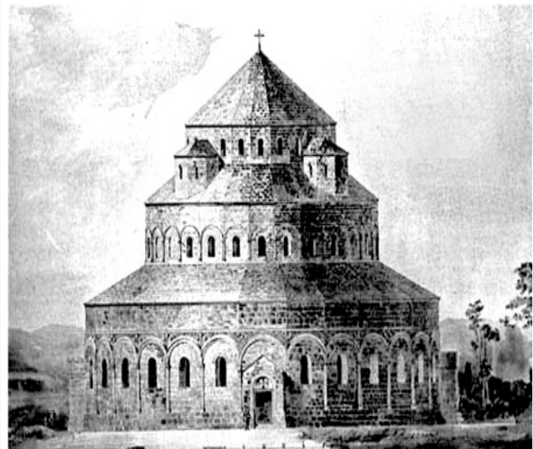
ისტორიული ბანას ტაძრის მსგავსი არქიტექტურის ეკლესია ხაშურშიც აიგება

“ურბნისში 1 წლისა და 2 თვის მოღვაწეობის შემდეგ გადამიყვანეს და დამადგინეს ყინწვისის წმიდა ნიკოლოზის სახელობის მონასტრის წინამძღვრად, სადაც 22 მაისს, იღუმენის ხარისხში ამიყვანეს და ოქროს ჯვრით დამაჯილდოვეს. საკმაოდ დიდი ტვირთი იყო არსებული ისტორიული მონასტრის წინამძღვრობა და მსახურება.