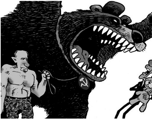
HENG LIANHE ZAORAO Singapore SINGAPORE