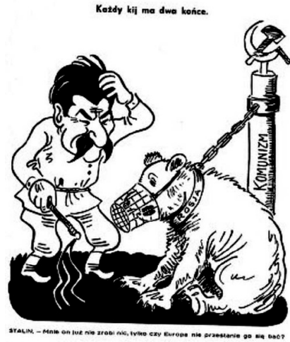
STALIN - Mnie on już nie zrobi nic, tylko czy Europa nie przesłanie go się bać?

Оба варианта карикатур направлены на создание негативного образа существующего политического режима, что косвенно ведет к негативному восприятию образа страны в целом. Цель этих действий — обеспечить внешнюю и внутреннюю поддержку свержению существующего руководства страны.