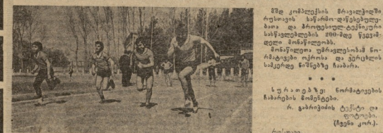
სუბიექტური ნიშნების განხილვის მომენტები