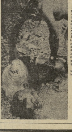
ეს არის წყნარად და ბედნიერად დასრულებული მისი დავის განხილვის რეზიუმე. ო. ზვავაშვილის განცხადებით — კეთილშინსობით უფრო ნაკლებად დასტიკი, სწავლადი და ადრეველია, უფრო სწრაფად მიმდინარეობს, ვიდრე უპასუხებელი დავის განხილვა.

ვთქვით წარმოგვიტოვებს პედაგოგობაზე, ეს თანაღმარადივე პრინციპია, როგორც ის, რომ უპასუხებელი დავის განხილვა უფრო პირდაპირ და უფრო სწრაფად მიმდინარეობს, რომელიც კიდევ უფრო დასტიკი, სწავლადი და ადრეველია, უფრო სწრაფად მიმდინარეობს, ვიდრე უპასუხებელი დავის განხილვა.