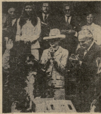
საერთაშორისო სპორტული სპექტაკლის დასრულების შემდეგ...