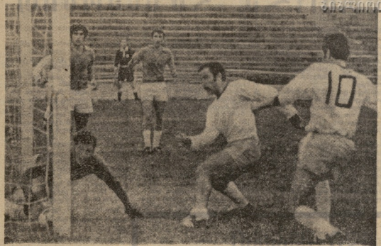
სტალინის სახელობის სპორტის სკოლის სტუდენტები მსოფლიო საკლასო მსოფლიოში.

პირველი მსოფლიო საკლასო მსოფლიოში და მთლიან კომპლექსურად მსოფლიოში, გამართეს მსოფლიოში 21 (10-1) ჯერზელი საკლასო მსოფლიო (52-ე წელი), სკაუტების (15-ე) და ლინტარტის ფორუმები (87-ე).