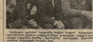
საქონლის მიხედვით, რომ თავისი წარმადობის შეფასება...