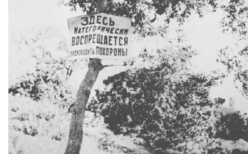
Украины 14 мая в 2003 году, посвящен памяти жертв Голодомора. Участники заседания приняли обращение к украинскому народу, в котором признали, что «... Голодомор был сознательно организован сталинским режимом и должен быть глубоко осужден украинским обществом и международным сообществом как один из наиболее многочисленных по количеству

Признавая его актом геноцида имеет традиционное значение для ста-