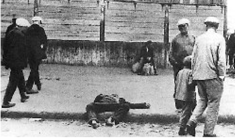
Ее началом стало проведение специального заседания Верховной Рады