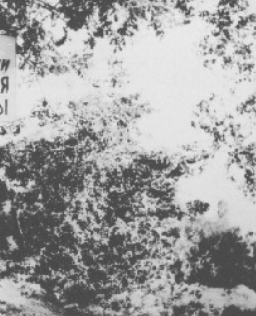
Украины 14 мая в 2003 году, посвящен памяти жертв Голодомора. Участники заседания приняли обращение к украинскому народу, в котором признали, что «... Голодомор был сознательно организован сталинским режимом и должен быть глубоко осужден украинским обществом и международным сообществом как один из наиболее многочисленных по количеству

Признавая его актом геноцида имеет традиционное значение для ста-