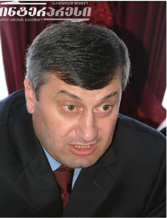
• НОВОСТИ ДНЯ • НОВОСТИ ДНЯ • НОВОСТИ ДНЯ • НОВОСТИ ДНЯ • НОВОСТИ ДНЯ • НОВОСТИ ДНЯ • НОВОСТИ ДНЯ •