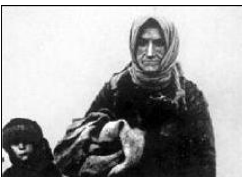
Глубокий след, оставленный голодомором в истории Украины, накладывает на другие трагедии, которые выпали на долю моего народа в XX столетии.

За пакет конституционных реформ проголосовали 93,182 избирателя (93,2 процента в составе населения) избирательной комиссии Республики Армения. Как заявили в ЦИК республики Итерфаксу, для одобрения пакета конституционных реформ за него должно было проголосовать не менее трети граждан, имевших право голоса, что составляет 767.276 голосов избирателей.