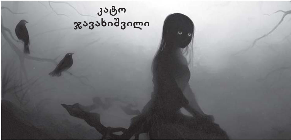
შუახნის გოგოს ამაზი