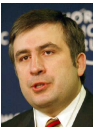
По материалам информационных агентств

вопросов» в городе Тальберге, организованном бывшим заместителем госсекретаря США Стробином Тэлботом. В своем выступлении президент Грузии акцентировал внимание на роли Грузии в Кавказском регионе, военной и политической реформах, демократических процессах и мерах по борьбе с коррупцией. Он подчеркнул, что в Грузии начались реформы, и что доведения их до конца, стране необходима поддержка международного сообщества. «В Грузии после революции роз» было проведено множество реформ, из них я особенно хотел бы отметить реформу, проведенную в силовых структурах. Однако в Грузии пока существуют нерегулированные конфликты, и для решения этих проблем нам необходима ваша поддержка», - заявил Михаил Саакашвили.