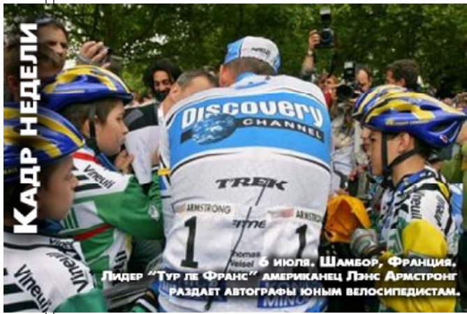
6 июля. Шамеор, Франция. Лидер «Тур де Франс» американец Лэнс Армстронг раздаст автографы юным велосипедистам.

Чемпион отомстил «Грассхоперсу» Циктишвили нравится Довецк «Золотой урожай» дзюдоистов Ашветия и Бойса поменяли команды