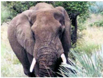
Результаты показали, что изменение климата отразится на Африке, континенте, являющемся родиной «большой пятёрки»: слона, носорога, льва, леопарда и буйвола.

Эксперты по состоянию окружающей среды считают, что климатические изменения представляют собой куда большую угрозу для фауны, нежели незаконный отстрел животных. В частности это касается слонов, тигров и носорогов. По мнению профессора Ричарда Лики, бывшего начальника управления по делам дикой природы Кении, глобальное потепление влечет за собой сокращение ареала обитания, может поставить ряд животных на грань вымирания.