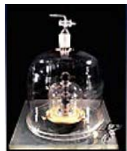
сы эталонного образца.

Слиток эталона уже на протяжении 115 лет хранится в Палате мер и весов (Bureau International des Poids et Mesures, BIPM) в парижском пригороде Севр. Время от времени палаты стандартов разных стран сверяют свои копии эталона с парижским оригиналом. Соединенные Штаты, например, делали это трижды с момента признания в 1889 году килограмма международным стандартом меры весов. И хотя эта