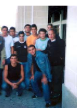
Ватерполисты Грузии в аэропорту Ла-Валетты (Мальта)

Назрела крайняя необходимость изменения самой технологии подготовки подрастающего поколения ватерполистов: строительство полноценных плавательных бассейнов — вопрос отдаленной перспективы, надо рассчитывать на условия ра-