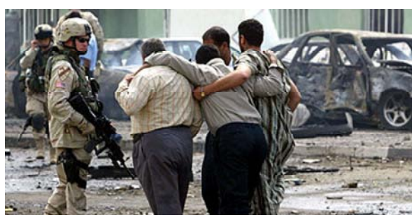
что бомбисты-самоубийцы, возможно, метили в колонну подразделений по охране автомобильных дорог. Один их полицейских, следовавших в той колонне, так описал произошедшее: «Мы продирались сквозь пробку, как вдури машины, ехавшая по забитой улице, взорвалась. Мы выехали на встречную полосу, туда же выехала еще одна машина, которая тоже взорвалась».

Последний из них произошел на рынке в окрестностях Багдада: погибли четверо полицейских, а шесть гражданских лиц получили ранения. В первой половине дня на многолюдной улице около МВД были взорваны подряд два автомобиля с водителями-самоубийцами. Число погибших составило как минимум 15 человек. Взрывы у МВД прогремели почти одновременно; улица на юго-востоке иракской столицы, на которой были приведены в действие взрывные устройства, была в это время забита транспортом. Ответственность за взрывы в Багдаде взяла на себя группировка под руководством иорданского боевика Абу Мусаб Аль-Заркави. Американские и иракские официальные лица в последнее время говорили о снижении уровня насилия в Ираке. Однако последние дни свидетельствуют о влечении, что боевики вновь активизировались. Представители МВД Ирака сообщили,