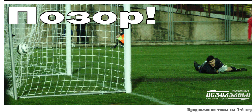
Продолжение темы на 7-й стр.