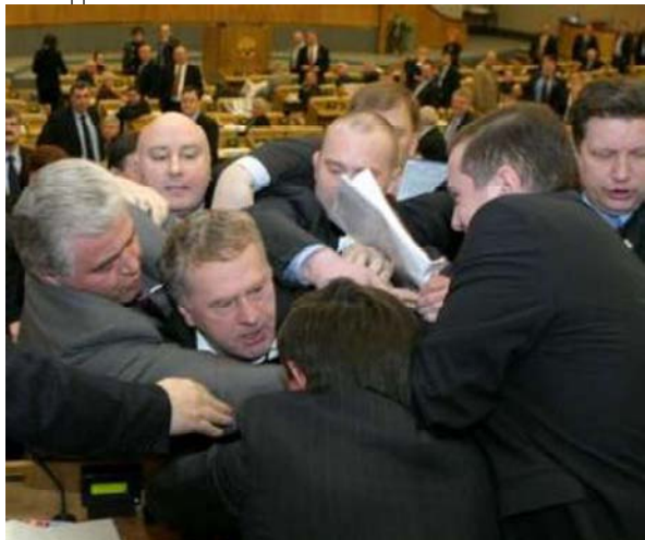
Так били Жириновского