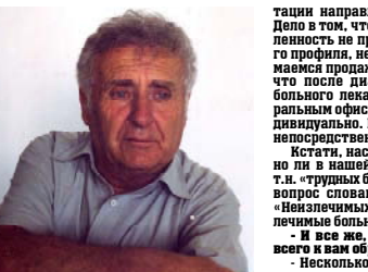
Центр народной медицины и координации международных связей Национальной академии Грузии создан несколько лет назад, но уже успел завоевать популярность.