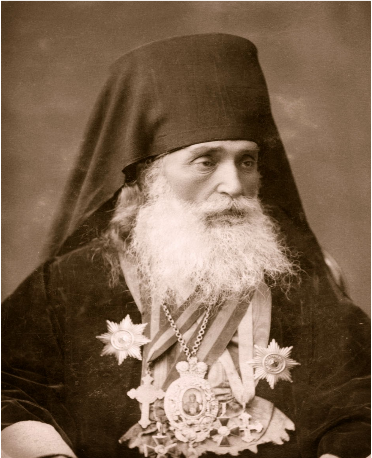
იმერეთის ეპისკოპოსი გაბრიელ ქიქოძე