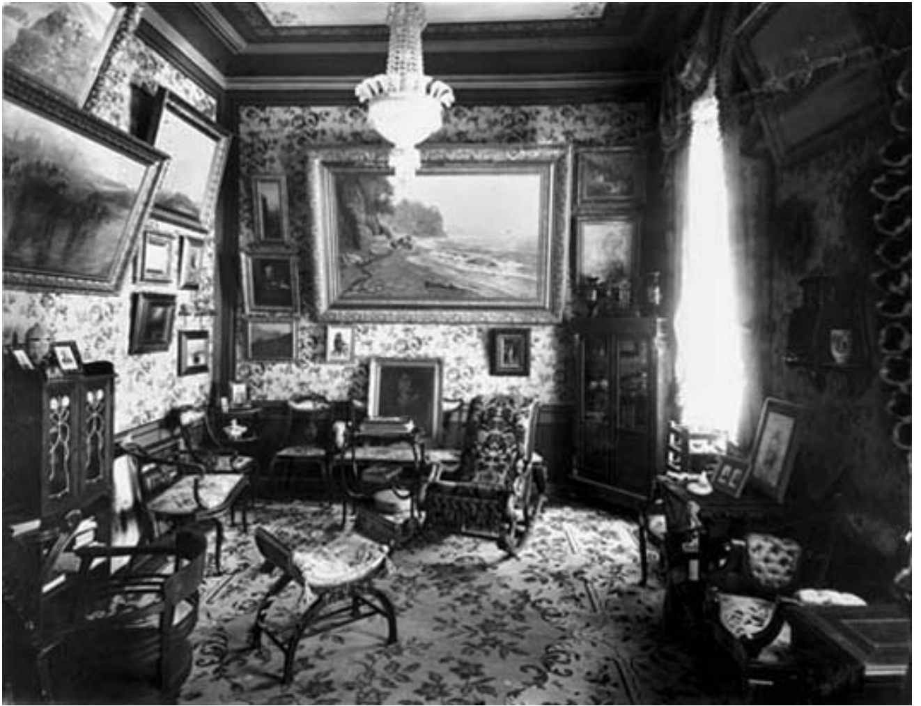
დავით სარაჯიშვილის სახლი