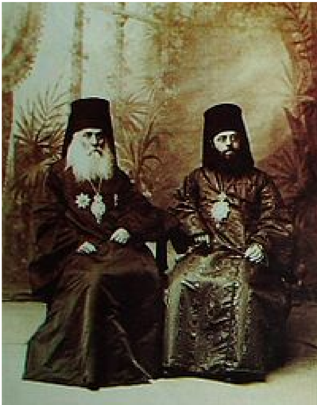
წმინდა ალექსანდრე ოქროპირიძე და ეპისკოპოსი ლეონიდ ოქროპირიძე