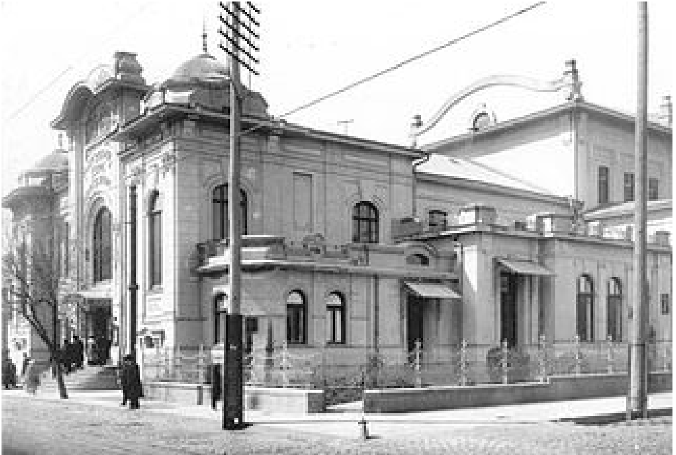
ზუბალაშვილების მიერ აგებული სახალხო სახლი (დღევანდელი მარჯანიშვილის თეატრი)