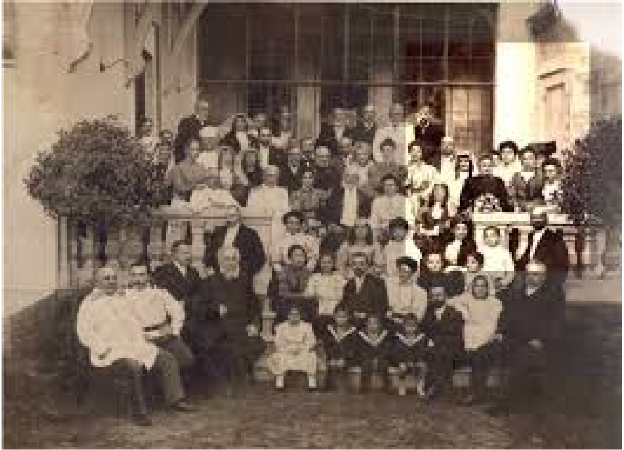
აკაკი წერეთელი დავით სარაჯიშვილის სახლში