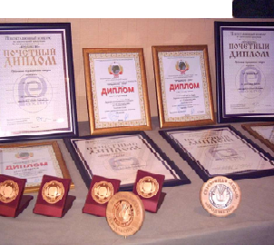
По словам представителя компании «Телиани вели»

С 14 по 18 февраля 2005 года в Москве проходила одна из самых престижных выставок алкогольных изделий «Фортис-2005». На выставке была представлена продукция грузинской компании «Телиани вели», которая завоевала пять золотых и одну серебряную медали.