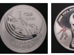
Под взглядом Национального банка Грузии и без расхищения грузинской стороны

Польский монетный двором Иелса Ралстона выпущена памятная монета достоинством в один ларь, посвященная чемпионату мира по футболу 2006 года.