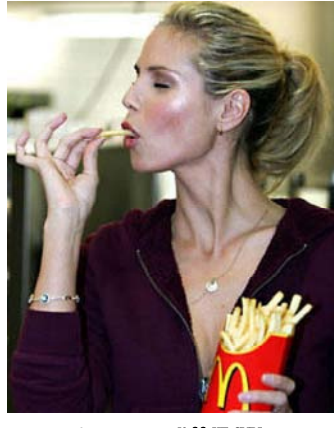
И 22 кг сыра