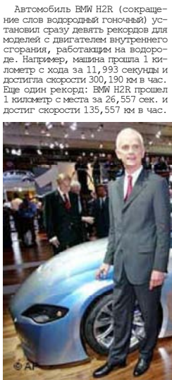
«Девятый рекорд — это только начало водородной эры», — заявил профессор Девьерс, член правления BMW, — наша технология достигла высокого

уровня, и теперь мы вместе с политиками и специалистами по энергетике должны плотнее заняться вопросом, как воплотить в реальность наши представления о непрерывной мобильности». Таким образом BMW доказывает, что водород может прийти на смену обычным видам топлива. Что же за автомобиль представил BMW? H2R имеет шестилитровый двенадцатилитровый двигатель, ко-