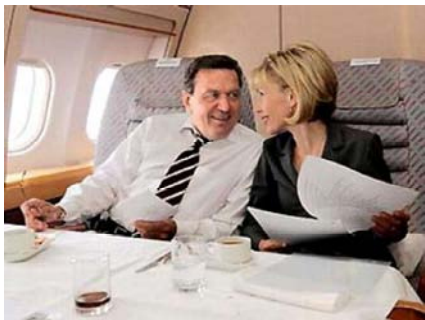
Супруга канцлера Германии Дорис Шредер-Кефф стала лауреатом премии «Самая выдающаяся женщина года 2004», учрежденной популярным немецким журналом «Фунте».