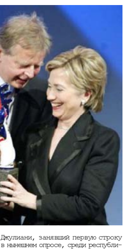
Джулиани, занявший первую строчку в нынешнем опросе, среди республиканцев вряд ли сохранит популярность за ближайшие четыре года. О его героических усилиях по преодолению последствий терактов 11 сентября постепенно позабудут. При этом основными властями в республике следует помнить, что он силно либерален. А либерализм не в почете у околицы кабинета.

симые эксперты, борьба за президентские кресло в 2008 году может развиться именно как rivalry между Райс и Клинтон. В США уже второй месяц идет общественная кампания по вытеснению главы Госдепа в президенты США. Например, в сети открыт неофициальный интернет-сайт «Объедини Райс и Клинтон». Райс при этом никак не реагирует на развернувшуюся ее вела пиар-кампанию. У Хиллари тоже есть группа сторонников, действующих самостоятельно. В сети уже несколько лет действует ее фан-клуб. В последнее время на них регулярно обсуждают шансы бывшей первой леди победить Кондолизе Райс. Не стоит сбрасывать со счетов также кандидатов № 2 от обеих партий. Джен Керри, как известно, уже не раз намекал, что готов снова участвовать в президентской гонимости. Он хоть и проиграл последние выборы, стал тем не менее гораздо популярнее в США. Есть определенные шансы на победу и у республиканца Маккейна, ветерана Вьетнама и в свое время главного соперника Буша-младшего в республиканской партии. А вот Рудольф