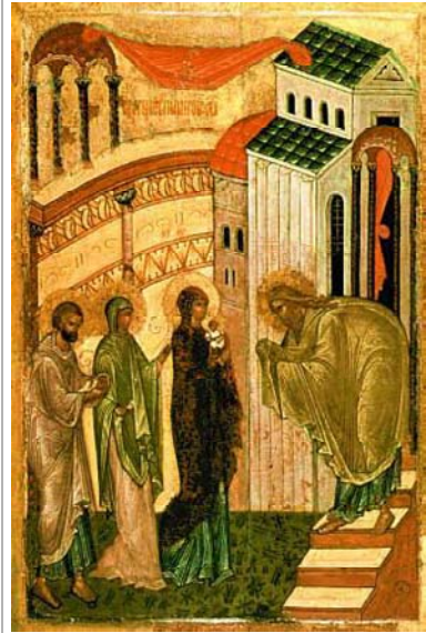
Православный мир отмечает сегодня один из двенадцатых, то есть главных церковных праздников – Сретение Господа нашего Иисуса Христа.

Сретение (в переводе – славная встреча) – праздник православной церкви, толкуется богословами как встреча Ветхого и Нового Заветов, встреча Закона, данного Богом, и Божественной Любви, принесенной в мир Иисусом Христом.