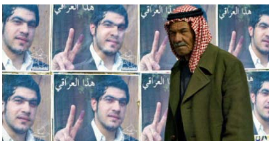
Объявлены итоги парламентских выборов в Ираке. Оказалось, что их выиграли даже не шииты, а курды. Именно от них теперь будет зависеть, кто станет новым президентом страны, а кто — премьер-министром. Не исключено, что президентом также станет курд, пишет Gazeta.Ru.

Убит экс-премьер Ливана Мощный взрыв прогремел в понедельник в центре Бейрута. Взрыв был такой силы, что задрожали окна в домах, расположенных на другой стороне города. По предварительным данным, в результате теракта погиб один человек и еще 12 получили ранения. Позднее стало известно, что теракт был осуществлен на бывшего премьер-министра Ливана Рафика Харири. Взрыв произошел в момент, когда кортеж Харири поравнялся с заминированной автомагистралью. По первоначальным данным, он не пострадал, но затем личная охрана экс-премьера заявила, что он был убит. В интервью телеканалу «Аль-Арабия» сообщил: Рафик Харири убит, погибли не менее трех охранников. Общее число погибших: не менее девяти человек.