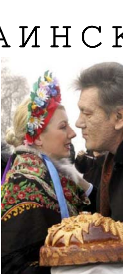
ко завершилась победой ориентированной на европейские структуры сил, но и обозначила, что президент Грузии Михаил Саакашвили назвал «третьей волной освобождения

Победа «оранжевой революции» в Украине открывает новые широкие горизонты этой страны. Крупнейшей в Восточной Европе и по своим масштабам вполне сопоставимой с Францией. Новые горизонты означают не только перспективы развития демократии, правового государства, расцвет и укрепление экономики и расширение прав человека. Они также ставят перед страной ряд новых проблем и вызовов, с которыми неизбежно придется считаться. И которые необходимо будет решать. Весь первый визит Ющенко нанес в Москву, но не следует забывать, что последние события в Украине нанесли серьезный удар по планам строительства нового союза России, Белоруссии, Украины и Казахстана. Союз, к которому должны были примкнуть Армения и Таджикистан, и контуры которого обозначили новые экономические, а затем и геополитические объединения. Украина очевидно устремилась в противоположную сторону — на Запад. И вся конструкция легко может рухнуть. А ведь на нее возлагались такие надежды! Теперь у России и Украины разные векторы внешней и внутренней политики. «Оранжевая революция» не толь-