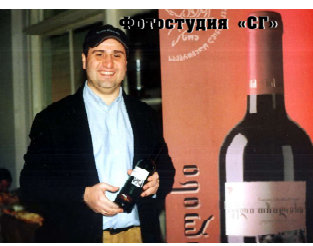
Ему присуждено звание «Лучшее вино года».

Другого и не могло быть. GWS уверенно занимает лидирующую позицию в винодельческой отрасли страны. Качество ее продукции по достоинству оценено и отмечено наградами самой высокой пробы на многих престижных и авторитетных международных выставках и конкурсах. Последний успех достигнут компанией на финише прошлого года в Москве. На традиционном конкурсе «Лучший продукт года», который проводит Национальная торговая ассоциация России, в впервые учрежденной номинации «Грузинские вина» победил бренд GWS «Тамара».