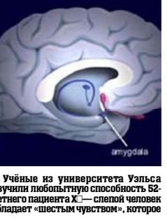
Учёные из университета Уэльса изучили способность 52-летнего пациента К.— слепой человек обладает «шестым чувством», которое

позволяет ему распознавать эмоции на лицах людей. Этот пациент перенес два удара, которые повредили области мозга, ответственные за обработку визуальных сигналов, сделал его абсолютно слепым.