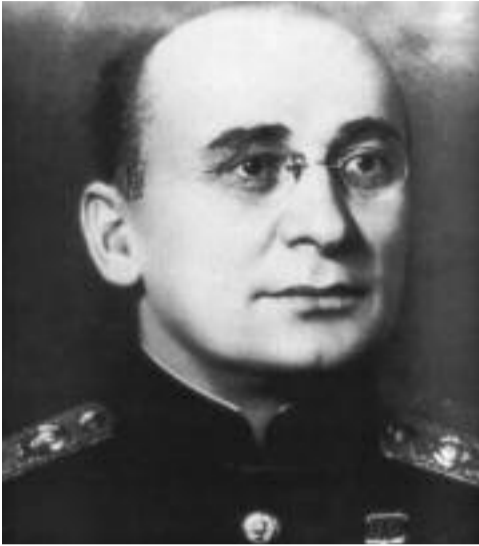
(გაგრძელება წინა ნომრიდან)

და კიდევ ერთი მეტად მნიშვნელოვანი წერილი. 1933 წლის 10 მარტს საკავშირო კომპარტიის (ბ) სამდივნომ ბერია ჩასვა სიაში, რომლითაც ცენტრალური კომიტეტის წევრებს ეგზავნებოდათ სხვადასხვა სახის მასალები – პოლიტიზურის, ორგანიზაციის და ცეკას სამდივნოს და სხვების ოქმები. მაგრამ ბერია მხოლოდ 1934 წელს იქნა არჩეული ცეკას წევრად, საკავშირო კომპარტიის (ბ) XVII ყრილობაზე.