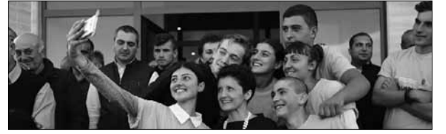
იხილეთ მე-3 გვერდზე