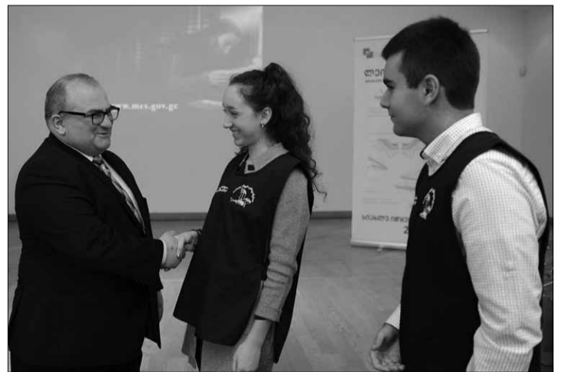
მფლობელები. 2010 წლიდან შოთა ფონდის ადმინისტრირებით ხორციელდება.

*** მოსწავლე გამოგონებელთა და მკვლევართა კონკურსის „ლეონარდო და ვინჩი“ მიზანია ზოგადსაგანმანათლებლო დაწესებულებებში მიმდინარე რეფორმების ხელშეწყობა; სასწავლო პროცესის სტიმულირება-სრულყოფა, სწავლისადმი ინტერესის გაღვივება; ინოვაციებისა და ტექნიკის მიმართ მოსწავლეთა ინტერესის გაღვივება; შემოქმედებითი აზროვნებისა და პრაქტიკული უნარ-ჩვევების განვითარება. გამოვლინდნენ გრანპრის, პირველი, მეორე და მესამე ადგილის