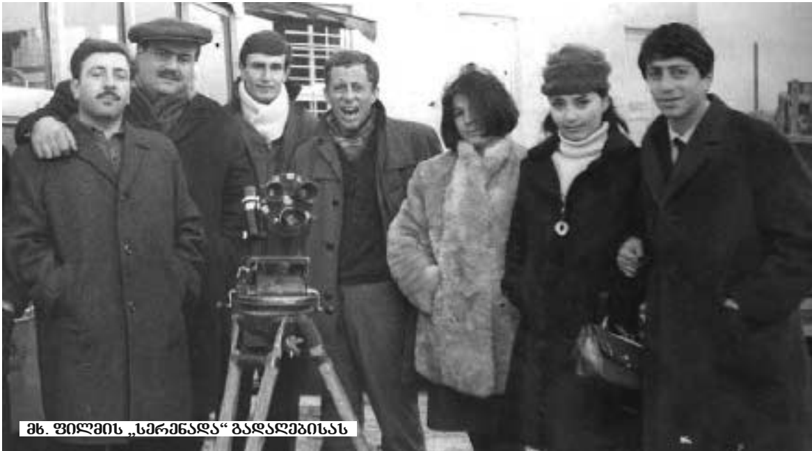
მხ. ფილმის „სმრანდა“ გადაღებისას