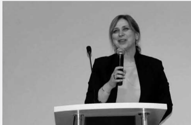
მოქალაქის როლში გვევლინება. განხილულია ასევე სტიგმა და სტიგმატიზაცია, რაც ამ ყველაფერს მოჰყვება და ამ ყველაფერის და კონფლიქტის მოგვარების გზები და ა.შ.

ბენ ბუღინგის შესახებ, მათ შორის, ყველაზე ცივილიზებული განათლების სისტემების მქონე ქვეყნებშიც, ერთ-ერთი ურთულესი და დაუძლეველი პრობლემაა, ბუღინგის, ასევე, რეინტეგრაცია. პერიოდულად ვიწყებთ ამაზე საუბარს და მერა, სამწუხაროდ, რაღაცნაირად მიჩვენდება სოფლი. თუმცა მიგვაჩნია, რომ ამის მიჩვენება არ შეიძლება. რაც შეეხება უშუალოდ სამოქალაქო განათლების მასწავლებლებს, მოგახსენებთ, ეს ადამიანები სხვა ტიპის მასწავლებლები არიან, უფრო გამჭოლ უნარებზე მუშაობენ მოსწავლეებთან, ვიდრე სხვა სახეობის საგნობრივი ტრენინგები. ჩვენ ეს მოდული უნდა მოგვამზადებინა ევროკავშირისთვის ასოცირების სამოქმედო გეგმის ფარგლებში, ერთგვარი ვალდებულება გვქონდა, რომ ამ წელიწადში შეგვექმნა მოდული და დაგვეწყო ტრენინგები. რაც შეეხება თემატიკას, ძალიან ვართობა და მოიცავს ინფორმაციას ბუღინგისა და მისი პრევენციის შესახებ – რა არის ბუღინგის ბუღინგის, რა ტერმინებს მოიცავს, რა ახარმონებს ბუღინგს, რატომ ძალადობენ ადამიანები ერთმანეთზე, მათ შორის მოსწავლეები, რა სახეობის ბუღინგის არსებობს, ვინ არის სინამდვილეში მსხვერპლი, რას წარმოადგენს ადამიანი, რომელიც