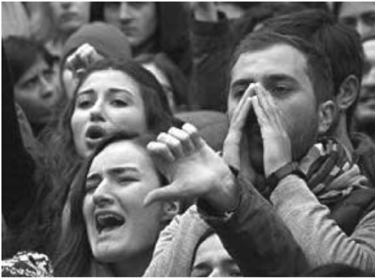
← 2 გვ.