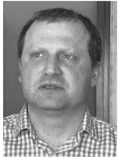
← 3 გვ.

აქვს, საკუთარ ჯიბეზე კი არა, ამერიკელი ხალხისთვის უნდა იფიქროსო“ ალბათ ჯონი და ჯორჯი ვერ იქნებიან მშვიდად. საინტერესოა ტრამპის ინაუგურაციაზე ბუჩქებში მყოფი „კურდღელი“ მეგობრად რჩება თუ მის წინააღმდეგ ამხედრებულ ხრონწ ლიბერალებს შეუერთდება, რომლებსაც სავარაუდოდ, ნაკლებად ცხელად ვეველგან წარუმატებელი, გაშიფრული, პრობლემებით დახუნძლული „პერსონა ნონ გრატისთვის...“