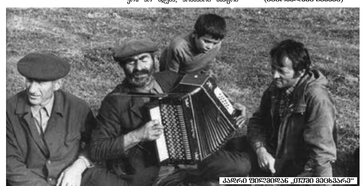
კადრი ფილმიდან „თუმი მცხვარე“

- კარგი ხალხი ჩაერია საქმეში და ფარულად მეზმარებიან. მაგრამ მე მაინც დაევიჭირე თადარიგი. ლამაზად დევდარიანმა და ლაბორატორიის გოგონებმა დიდი საქმე გამიკეთეს