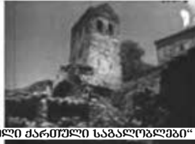
კადრები ფილმიდან „მეორე ქართული საბავშვო“