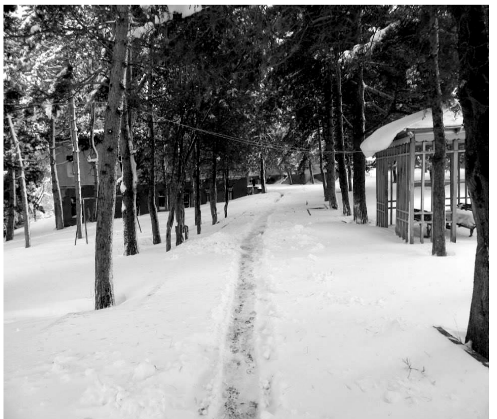
დიმიტრი ყიფიანის მუზეუმის ეზო ზამთარში