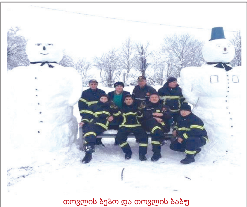
თოვლის ბებო და თოვლის ბაბუ

„ეტალონის“ წამყვანმა გონა ტყეშელაშვილმა აღნიშნა, რომ ხაშურმა გორის რეკორდი გაიმეორა და მარიამმა 84 ქულის მოპოვება შეძლო. ხაშურის მუნიციპალიტეტში პროექტის მხარდამჭერები იყვნენ მუნიციპალიტეტის გამგეობა და ადგილობრივი რესურსცენტრი.