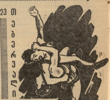
სს. ცირაზი ნაბარბაზი სპორტულ-მუსიკალური სახეობის მსახივართა კოლექტივი