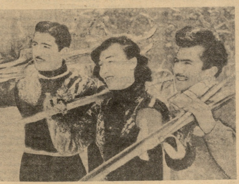
საქართველოს კომუნისტური პარტიის XX ყრბლისა და სსრკ-ის კომუნისტური პარტიის XX ყრბლისა...