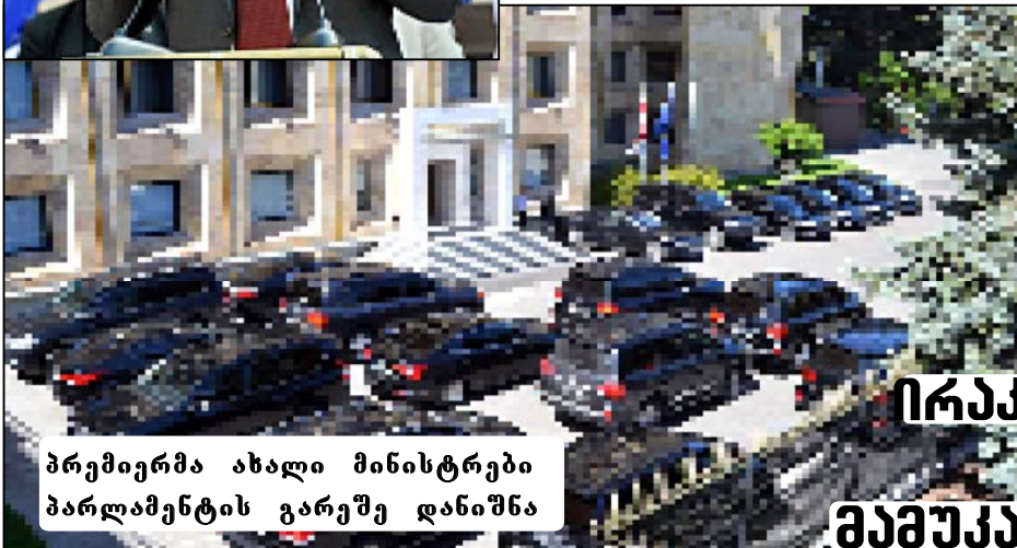
პრემიერმა ახალი მინისტრები პარლამენტის გარეშე დანიშნა

ირაკლი ღარიბაშვილი გადაყენებისგან შემოქა საზარაქემ იხსნა“ 83.4