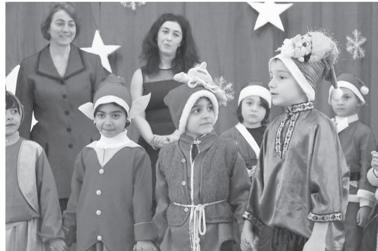
გრიბის გავრცელება მაქსიმალურად შეზღუდულია.

ბავშვებს აქვთ მუსიკისა და ცეკვის შესანიშნავი დარბაზი.