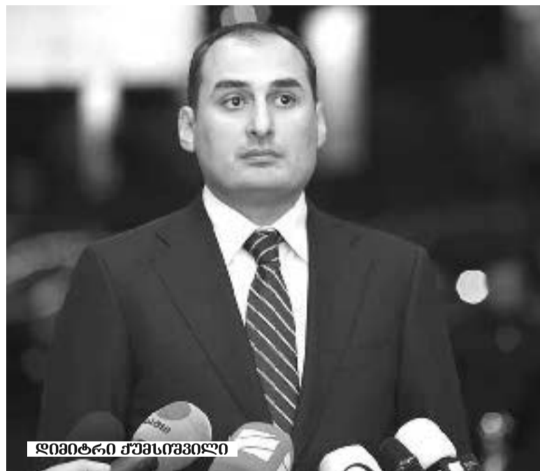
დეპუტატ-პრემიერი ლევან ხაჩატრიანი

იღებს შეღავათიანი კურსით სესხების გალარების ხარჯების სუბსიდირებას, ეროვნული ბანკი კომერციულ ბანკებს მიაწვდის გალარებისთვის საჭირო აშშ დოლარს და მოახდენს ლარის ლიკვიდობით მხარდაჭერას. კომერციული ბანკები კი ვალდებული არიან პროგრამის შესახებ აცნობონ ყველას, ვისაც შეიძლება ეხებოდეს სუბსიდიამ.