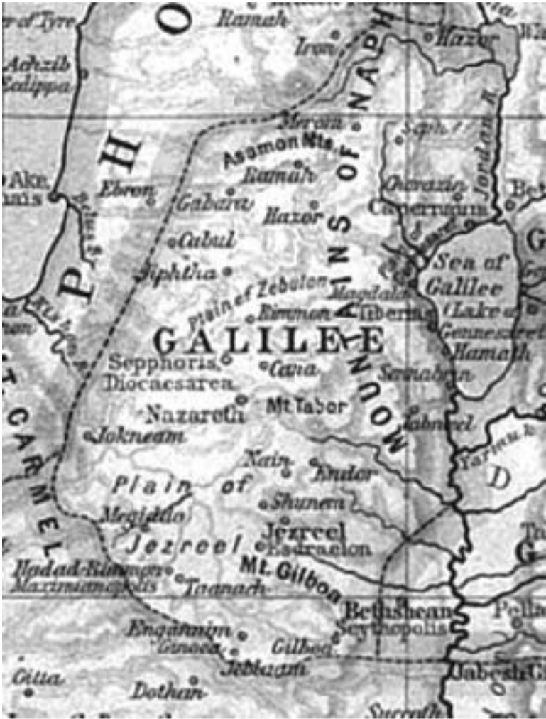
(ბაბრქმლვა, დასაწყისი 0ხ. „სპ“ N1 2017)

იაფეტის ძე იავანში, როგორც უკვე ითქვა, „ვანის სამეფო“, ანუ ვანის ტბისა და არარატის სანახები იგულისხმება და არა ძველ საბერძნეთში მცხოვრები, შეცდომით ბერძნულ ტომებად მიჩნეული იონიელები. იონიელები იბერიულ-კავკასიური პელაზგებისა და დანაიდების მონათესავე ტომები იყვნენ.