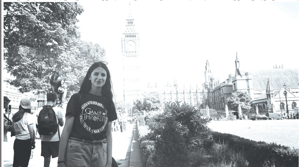
უნდა აღვნიშნო, რომ პირველი გასემოხნდა. ასევე, ბოგ ბენი იყო საოცარი,

სია, უამრავი განყოფილებით, სწორედ აქ ვცხოვრობდით და ვსწავლობდით. დღეში სამი საათი გეიტარდებოდა ინგლისურის ენის გაკვეთილები, უმეტესწილად თავისუფალი გრაფიკი გვექონდა, კვირაში ორჯერ დავდიოდით ექსკურსიებზე. ყველაზე დიდი შთაბეჭდილება, პირველ რიგში, ბრიტანელმა ხალხმა მოახდინა, საოცრად გახსნილი და მოსიყვარულე ერი აღ-